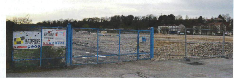
Le site de la SED n'est plus qu'un terrain vague... pour l'instant !