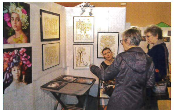
Les femmes artistes à l'honneur.

«Femm'Arts» a donc permis à une vingtaine d'artistes, francs-comtoises, alsaciennes et vosgiennes, de donner un aperçu de leur talent à travers la peinture, la sculpture, le patchwork, le cuir ou la peinture sur tous supports.