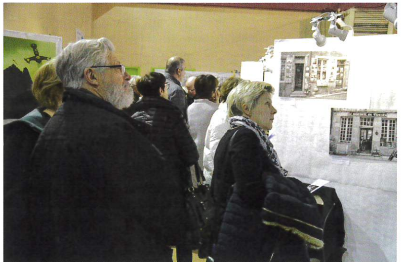
Les visiteurs ont pu apprécier de superbes clichés.

Cet ancien photographe de L'Est Républicain , puis d'une agence parisienne, cultive depuis toujours sa passion pour les belles images. Comme il l'a souligné, la photo est devenue pour lui un «virus», tout comme celui de l'écriture. Au fil du temps, il a également découvert le plaisir de faire partager sa passion aux autres et donc d'exposer ses œuvres.