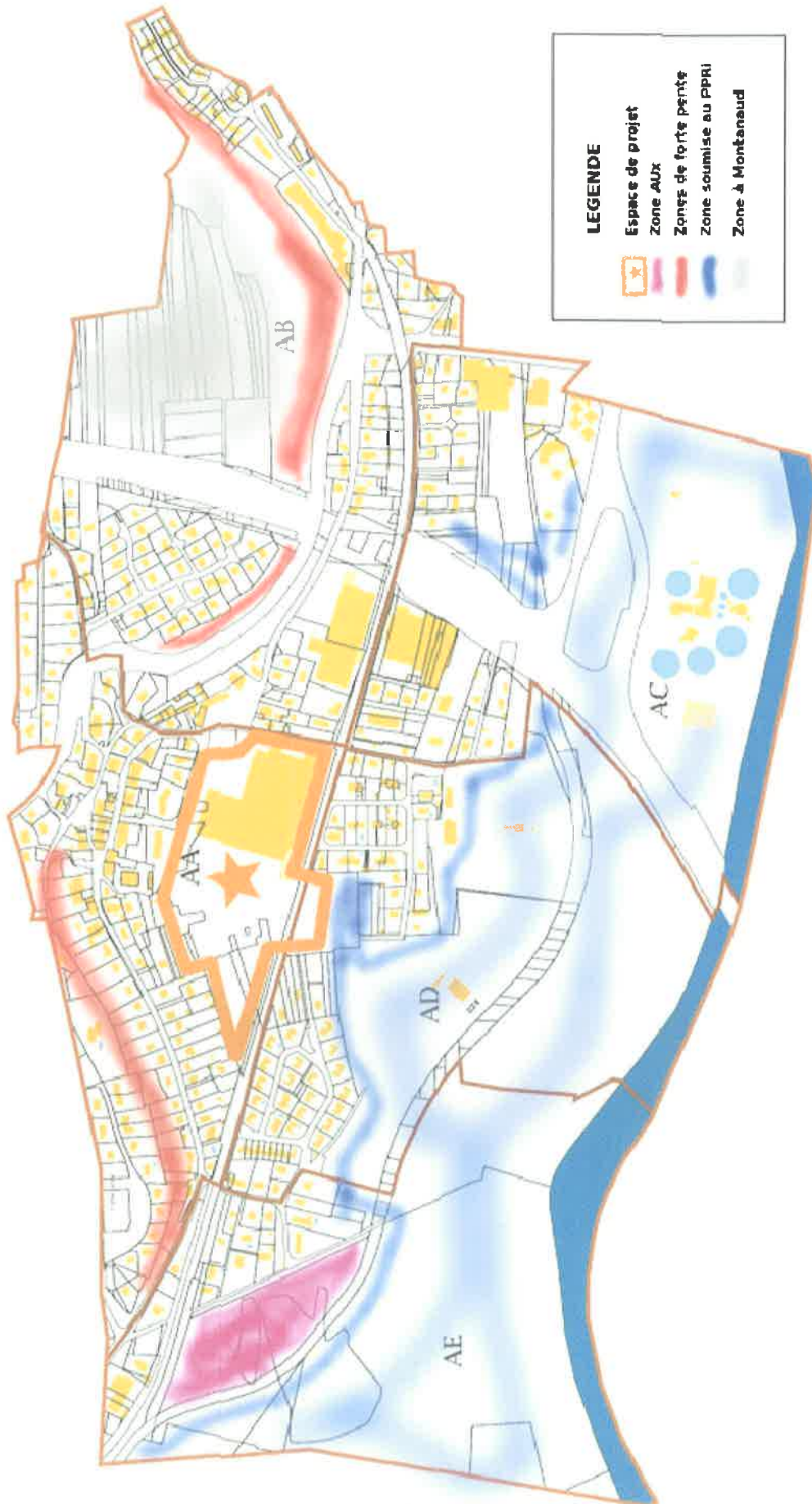
Schéma illustrant les espaces disponibles et les contraintes