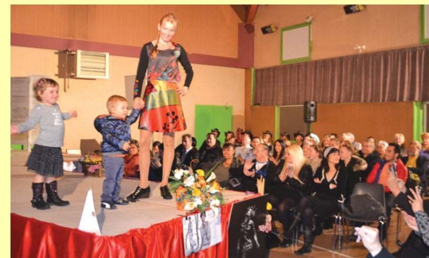
Les mannequins en herbe n'ont pas été les moins applaudis !

La Salle polyvalente a servi de cadre, le 15 octobre dernier, à un défilé de mode automne/hiver doublé d'un spectacle de danse country. Cette soirée a été organisée par le Lions-Club Comtesse Henriette et l'association Défil'Mode, au profit de l'ADAPEI du Pays de Montbéliard.