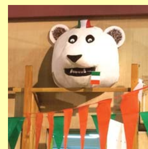
L'ours veillait sur la soirée !

L'édition 2016 de la Fête des Ours a été placée sous le signe de l'Italie. La Municipalité, les Oursons et Fest'Arbouans ont rassemblé une centaine de convives à la Salle polyvalente autour d'un menu typiquement transalpin. Au menu : du risotto !