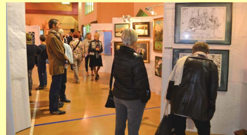
Les amateurs y ont trouvé leur compte...

toujours d'un format important. Il s'agit pour elle de créer une œuvre abstraite en jouant avec les formes et les couleurs.