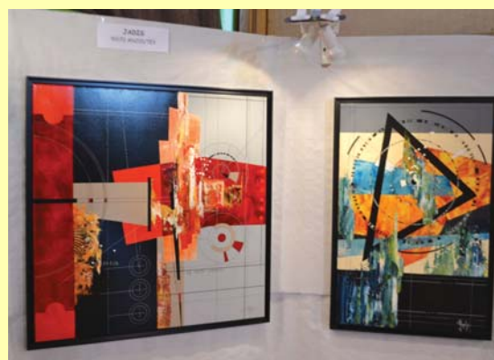
Les toiles abstraites de Jadis.

La 14 ème édition d'Art'Bouans, le salon de peinture et sculpture d'Arbouans organisé par le Comité des Fêtes, a tenu toutes ses promesses. Une vingtaine d'artistes y ont exposé quelques œuvres, dans des domaines et des techniques très différents, de quoi satisfaire tous les publics.