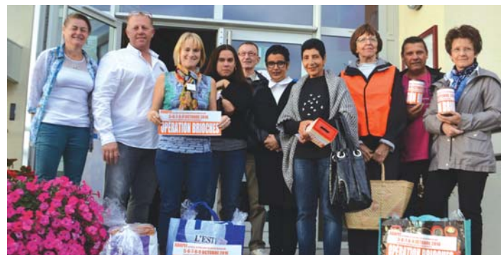
Une partie de l'équipe des bénévoles...