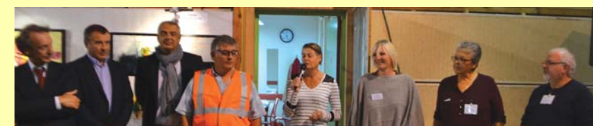
A l'heure du vernissage, les nombreux élus présents ont vanté la qualité du Salon d'Arbouans.

Cette année, le rang d'invitée d'honneur est revenu à Jadis, une artiste de renommée internationale qui expose ses toiles dans de nombreux pays. Peintre autodidacte, elle compte parmi les artistes les plus connues de sa génération. Depuis 2008, Jadis peint principalement l'abstraction et ses toiles sont