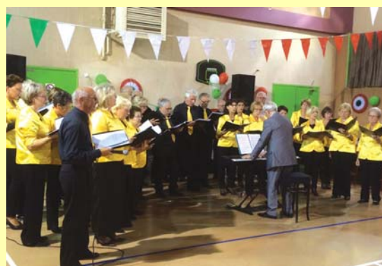
La chorale Voce d'Italia a interprété des chants italiens.

L'édition 2016 de la Fête des Ours a été placée sous le signe de l'Italie. La Municipalité, les Oursons et Fest'Arbouans ont rassemblé une centaine de convives à la Salle polyvalente autour d'un menu typiquement transalpin. Au menu : du risotto !